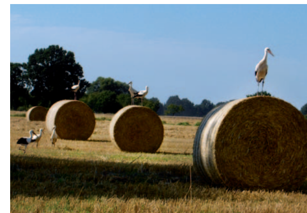
Störche am Elbdeich

Start: Winsen/Luhe Streckenverlauf: Hoopte, Niedermarschacht, Tespe, Avendorf, Bütlingen, Oldershausen, Tönnhäusen, Seebrücke Ziel: Winsen/Luhe