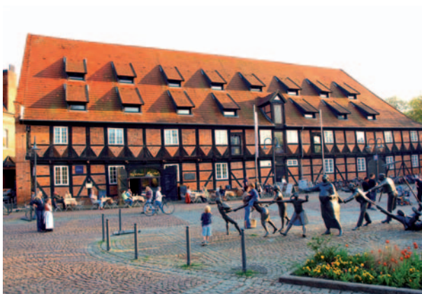
Marshall in Winsen