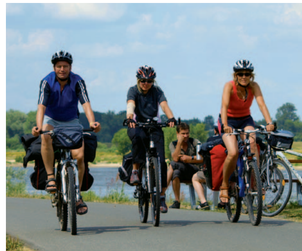
Elbe und Marsch sind eine Reise wert