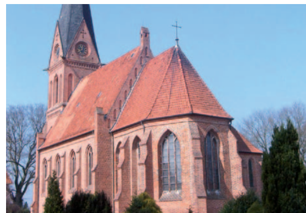
Kirche in Ramelsloh

Start: Winsen/Luhe Streckenverlauf: Stöckte, Over, Maschen, Ramelsloh, Ohlendorf, Holtorfsloh Ziel: Winsen/Luhe